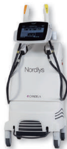
Nordlys™ 皮膚色素性疾患用光治療器