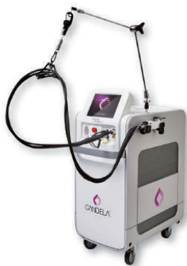
GentleMax Pro Plus™ 長期減毛・色素性疾患用レーザー装置