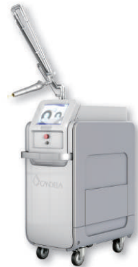
PicoWay® ピコセカンド KTP / Nd:YAGレーザー