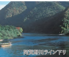
阿賀野川ライン下り