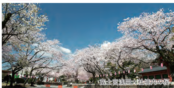
富士宮浅間大社境内の桜