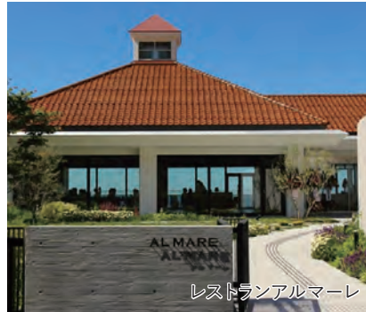
レストランアルマーレ