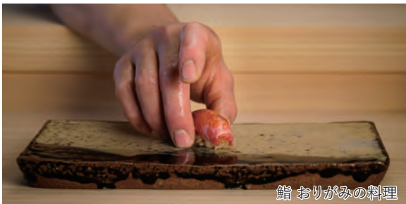
鮨 おりがみの料理