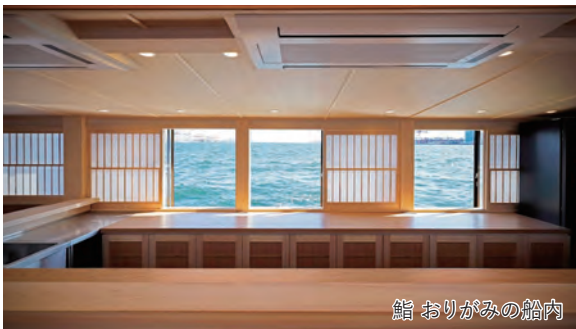
鮨 おりがみの船内