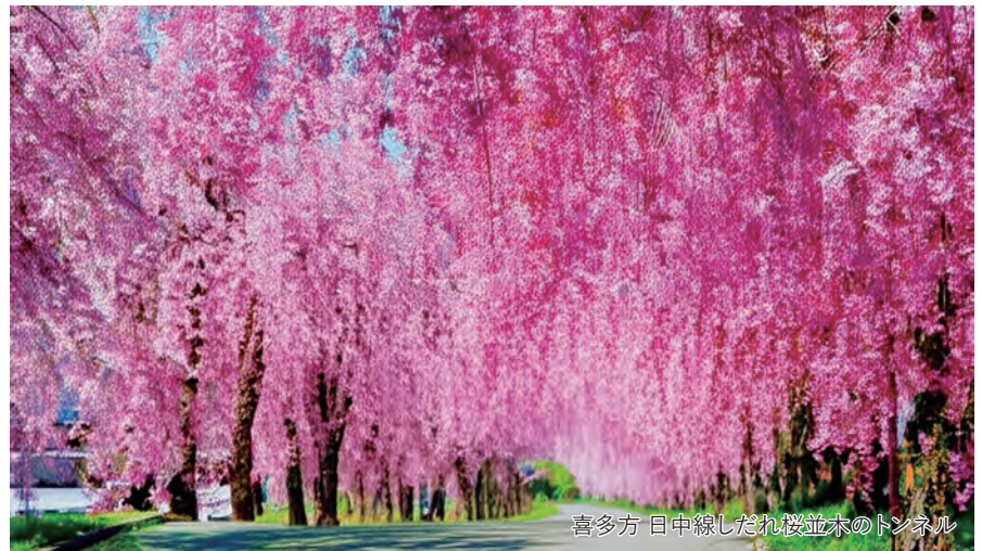
喜多方 日中線しだれ桜並木のトンネル

旅行期間 2026年4月18日(土)～19日(日) 旅行代金 お一人様 158,000円(2名1室/伊丹空港発着) ※洋室・和洋室ご希望の場合、おひとり様10,000円追加 ※伊丹空港発着以外ご希望の場合は、お問い合わせください。 募集人数 12名(最少催行人数10名) 添乗員 同行いたします 交通機関 航空機・現地貸切バス(運行バス会社:泉観光バス) 食事条件 朝1回・昼1回・夕1回 宿泊場所 村杉温泉／風雅の宿 長生館(和室)