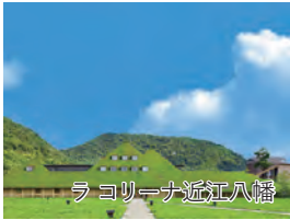
ラ コリーナ近江八幡