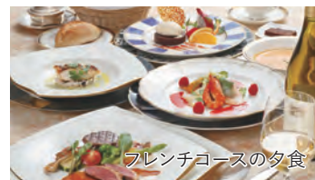
フレンチコースの夕食