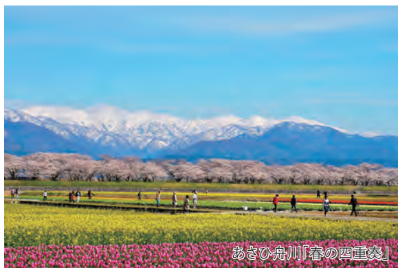
あさひ舟川「春の四重奏」