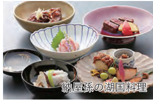
納屋孫の湖国料理