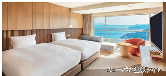
ビューパス温泉ツイン