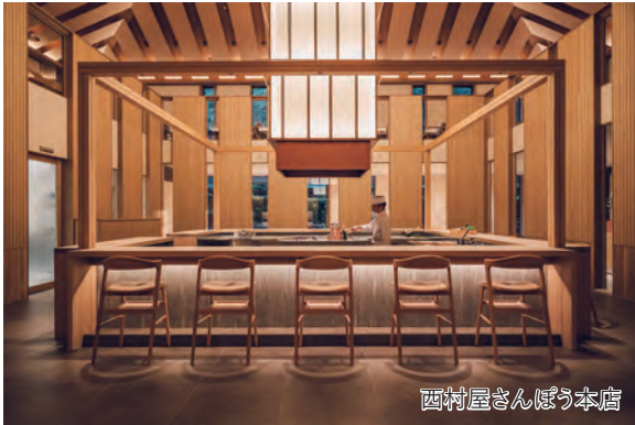
西村屋さんぽう本店