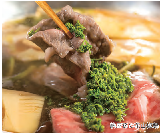
納屋孫の花山椒鍋