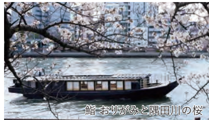
鮨 おりがみと隅田川の桜