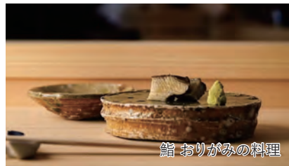
鮨 おりがみの料理