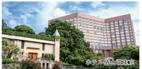
ホテル椿山荘東京