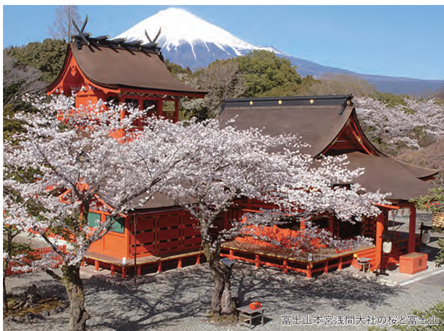
富士山本宮浅間大社の桜と富士山

宿泊場所 熱海温泉/ホテルグランバッハ熱海クレッシェンド (ビューパス温泉ツイン)