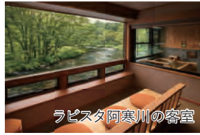
ラピスタ阿寒川の客室