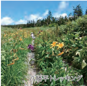
八幡平トレッキング