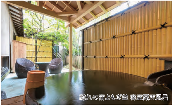
離れの宿よもぎ埜 客室露天風呂