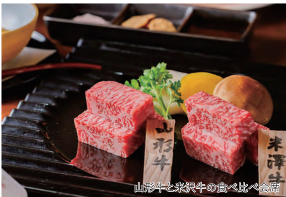
山形牛と米沢牛の食べ比べ会席