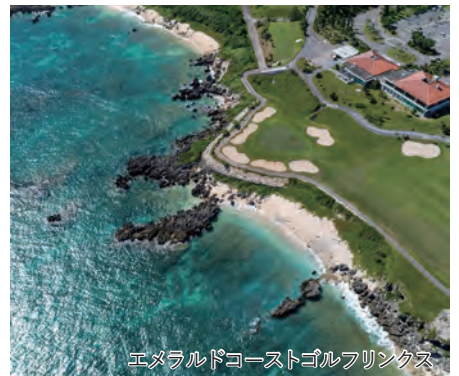
エメラルドコーストゴルフリンクス