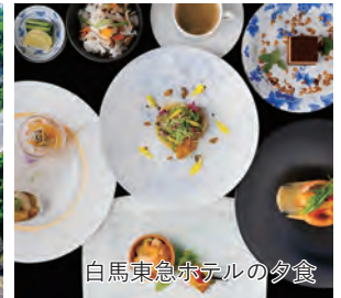
白馬東急ホテルの夕食