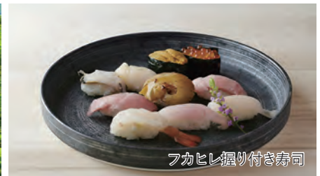
フカヒレ握り付き寿司