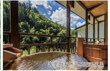
客室の天然温泉露天風呂