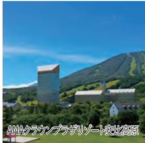
ANAクラウンプラザリゾート安比高原