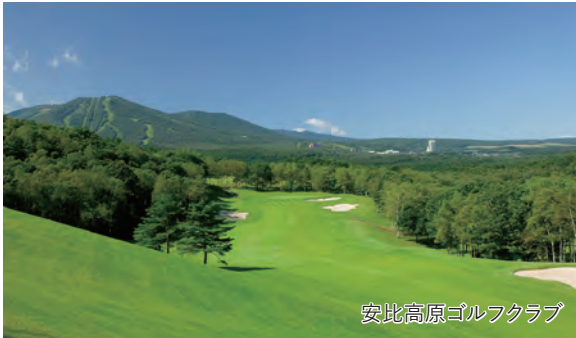
安比高原ゴルフクラブ

～憧れの名門コースでのゴルフプレーまたは周辺観光から選べる滞在プラン～ 世界が注目する避暑地 安比高原リゾートで過ごす優雅な休日3日間