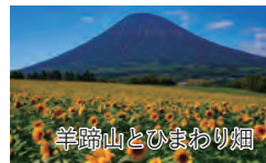
羊蹄山とひまわり畑