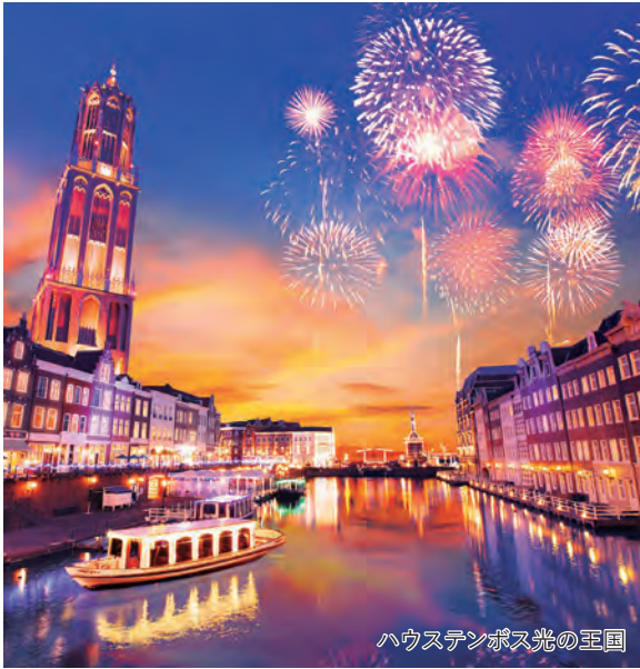
ハウステンボス光の王国