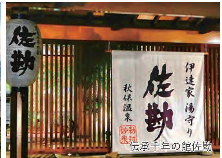
伝承千年の館佐勤