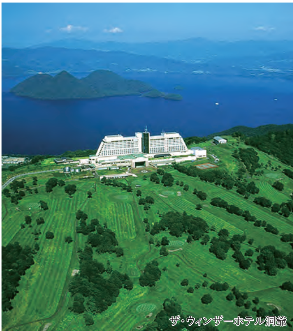
ザ・ウィンザーホテル洞爺