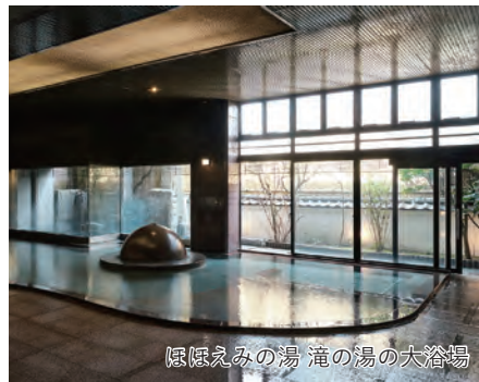
ほほえみの湯 滝の湯の大浴場