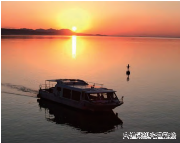
宍道湖観光遊覧船