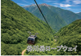
谷川岳ロープウェイ