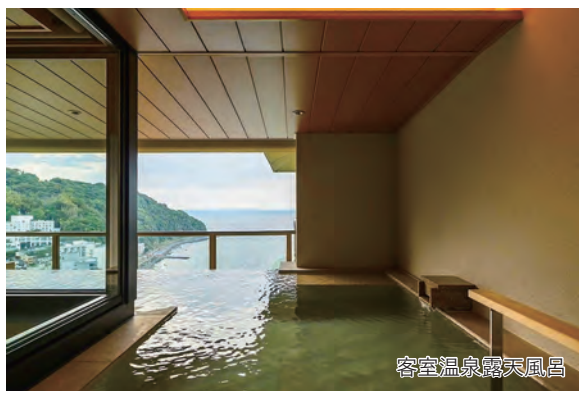
客室温泉露天風呂