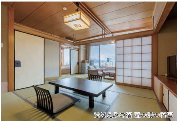
ほほえみの宿 滝の湯の客室