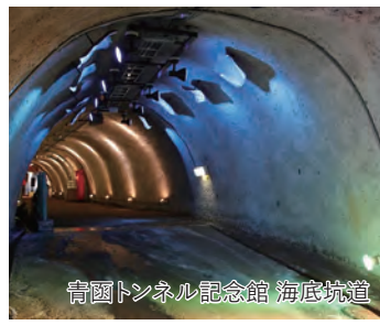
青函トンネル記念館 海底坑道