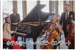
ホテルヨーロッパロビーコンサート