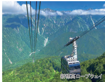
新穂高ロープウェイ