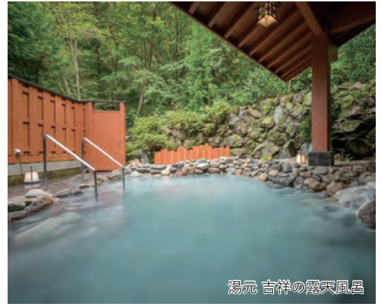
湯元 吉祥の露天風呂