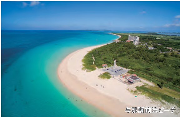
与那覇前浜ビーチ