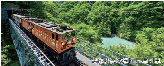
黒部峡谷鉄道トロッコ列車