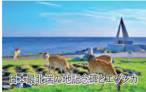
日本最北端の地記念碑とエンシカ