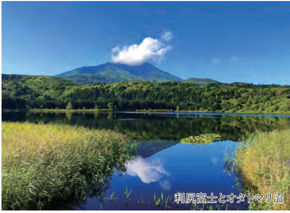
利尻富士とオタドマリ沼