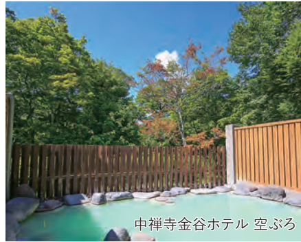
中禅寺金谷ホテル 空ぶろ