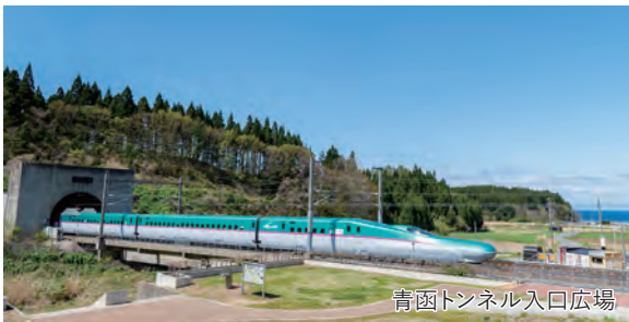
青函トンネル入口広場