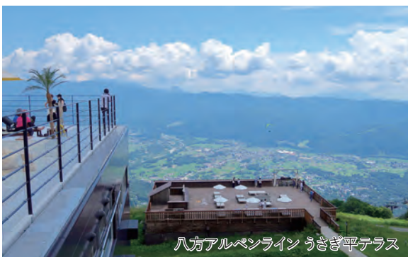
八方アルペンライン うさぎ平テラス