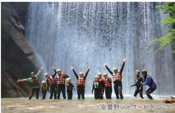
安曇野シャワーピクニック