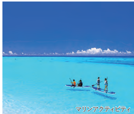
マリナクティビティ