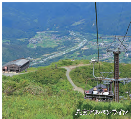
八方アルペンライン