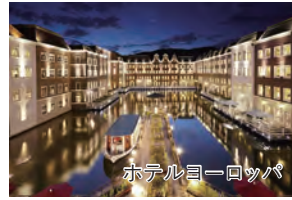
ホテルヨーロッパ