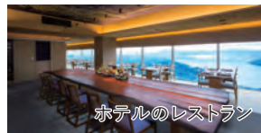
ホテルのレストラン