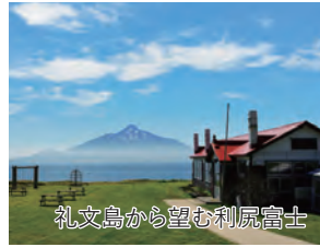
礼文島から望む利尻富士