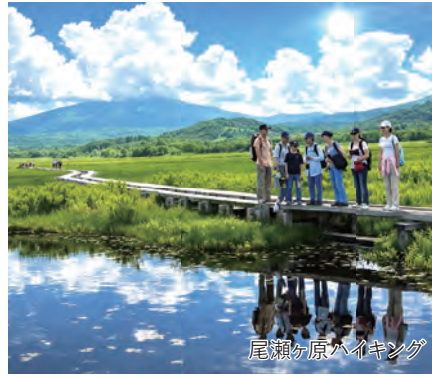
尾瀬ヶ原ハイキング