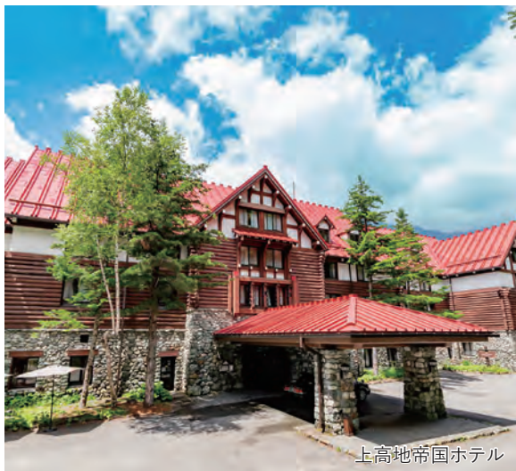
上高地帝国ホテル