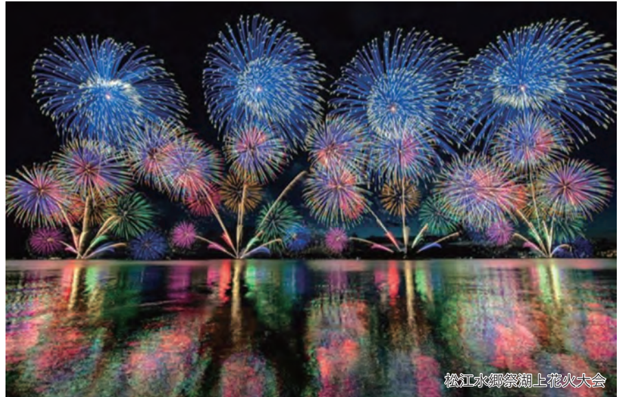
松江水郷祭湖上花火大会