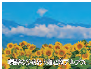
明野のひまわり畑と南アルプス