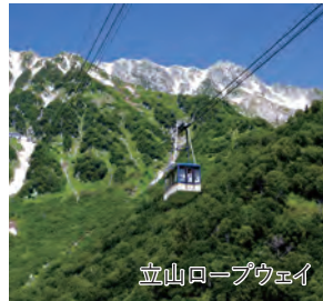
立山ロープウェイ