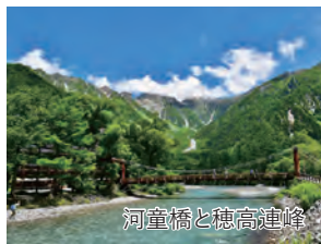
河童橋と穂高連峰