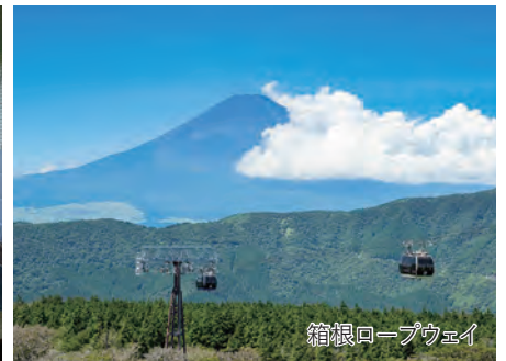
箱根ロープウェイ