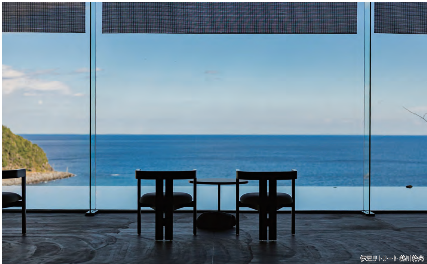
伊豆リゾート 熱川粹光

絶景と波音に包まれる「伊豆リゾート 熱川粹光」で過ごす伊豆の恵みを堪能する3日間