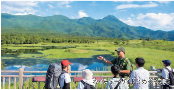
ネイチャーガイドとめぐる知床