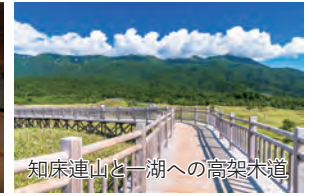
知床連山と一湖への高架木道