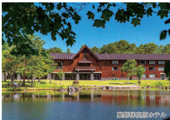
裏磐梯高原ホテル