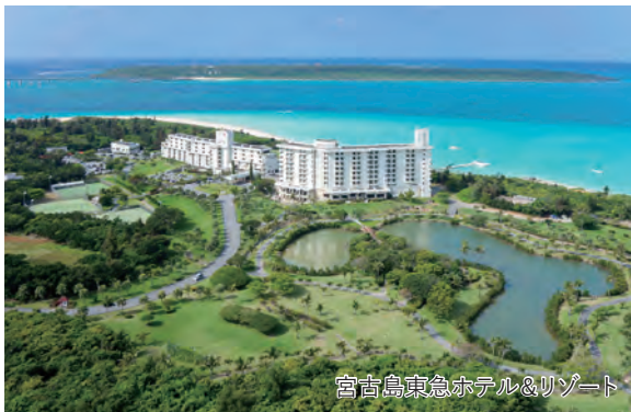
宮古島東急ホテル&リゾート