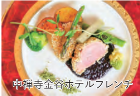
中禅寺金谷ホテルフレンチ