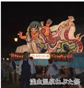
浅虫温泉ねぶた祭