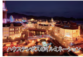
ハウステンボスのイルミネーション