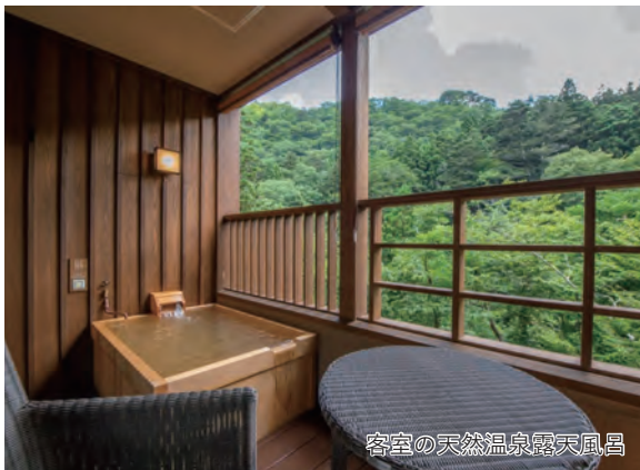
客室の天然温泉露天風呂