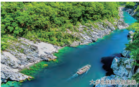
大歩危峡観光遊覧船