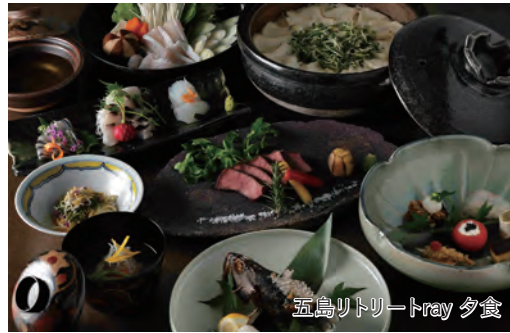
五島リトリートray 夕食