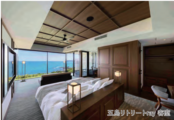
五島リトリートray 客室