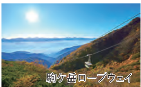
駒ヶ岳ロープウェイ