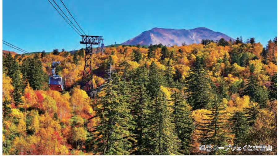
旭岳ロープウェイと大雪山