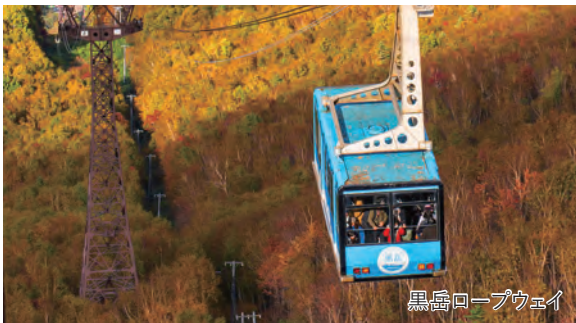
黒岳ロープウェイ