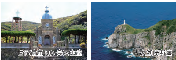
世界遺産 頭ヶ島天主堂