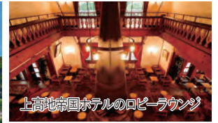
上高地帝国ホテルのロビーラウンジ