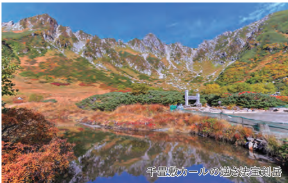
千畳敷カールの逆さ法室剣岳