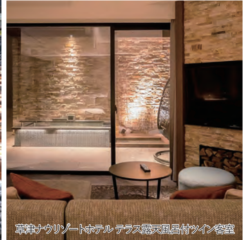
草津ナウリゾートホテル テラス露天風呂付ツイン客室