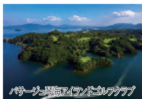
パサージュ琴海アイランドゴルフクラブ