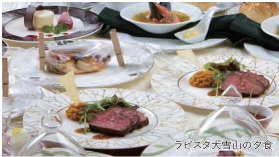
ラピスタ大雪山の夕食