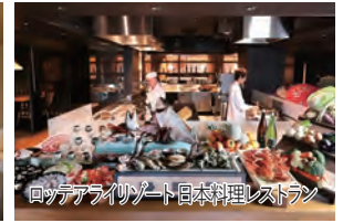
ロッテアライリゾート日本料理レストラン